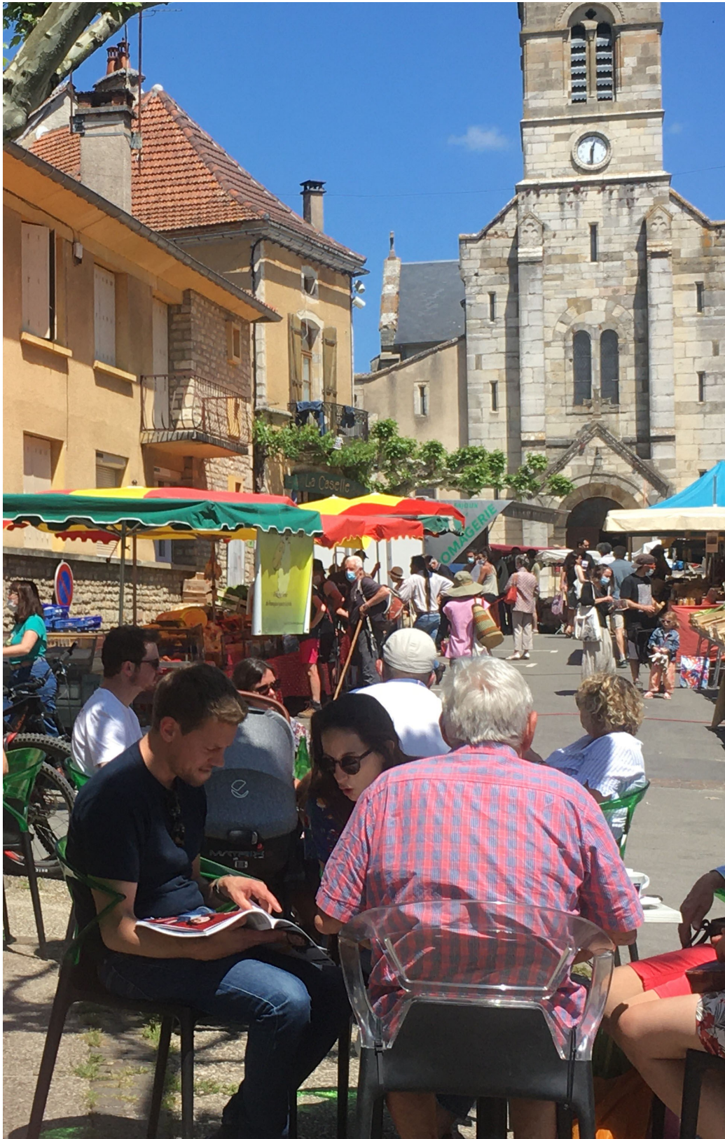
Le marché dominical vu du Galopin. Même perspective que le célèbre tableau d'un des meilleurs peintres locaux, Maurice Lancini.

Le Limogne infos - La Gazette - Magazine édité par la mairie de Limogne. La commission communication remercie tous les contributeurs. Rédaction : Christophe Wargny. Conception : Juliette Léveillé. Directeur de la publication : Jean-Claude Vialette, maire. Impression : mairie de Limogne. Tirage : 400 exemplaires.